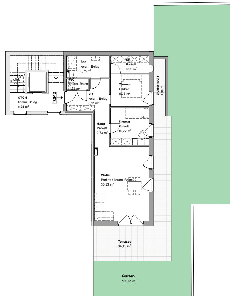
TOP 2 EG M 1:200